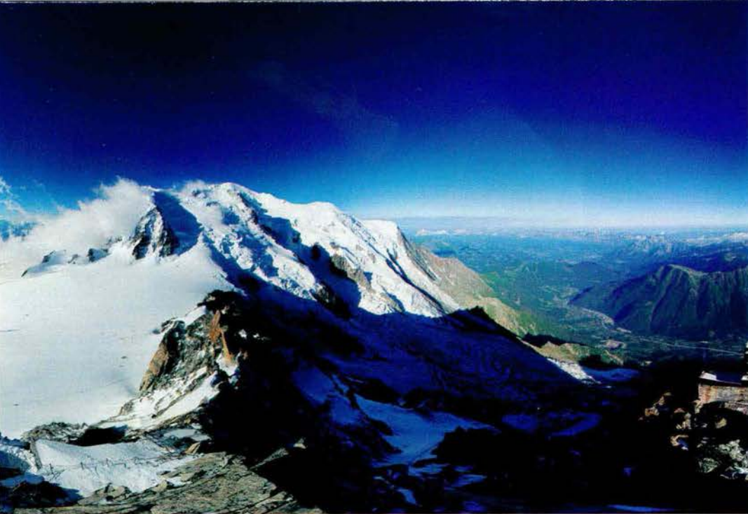
CHAMONIX, IN FRANCIA. VEDUTA PANORAMICA DEL MONTE BIANCO DALL'AIGUILLE DU MIDI

Presentato sei anni fa quale "omaggio alla montagna e nuovo simbolo della Svizzera", il progetto è in stand-by in attesa che passi la crisi ma niente affatto cancellato, nonostante l'insurrezione di chi, la montagna, l'ama per ciò che è.