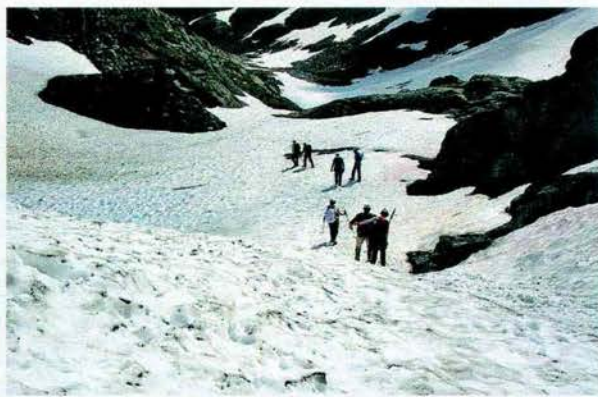
DISCESA DAL COLLE DEL GRAN SAN BERNARDO. SOTTO: VEDUTA DI COGNE, NEL PARCO NAZIONALE DEL GRAN PARADISO. A SINISTRA: CHAMONIX, IN FRANCIA, LA CIMA DELL'AIGUILLE DU MIDI